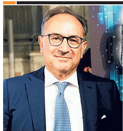
▲ L'archeologo Giuliano Volpe è docente a UniBa

In questo senso l'autore precisa che le sue “passeggiate” hanno volontariamente evitato di parlare dei maggiori musei della regione (cosa che avrebbe richiesto un volume ulteriore), indicando più semplicemente alcune raccolte museali in grado di aiutare la comprensione dei luoghi. In questo libro vanno evidenziate alcune im-